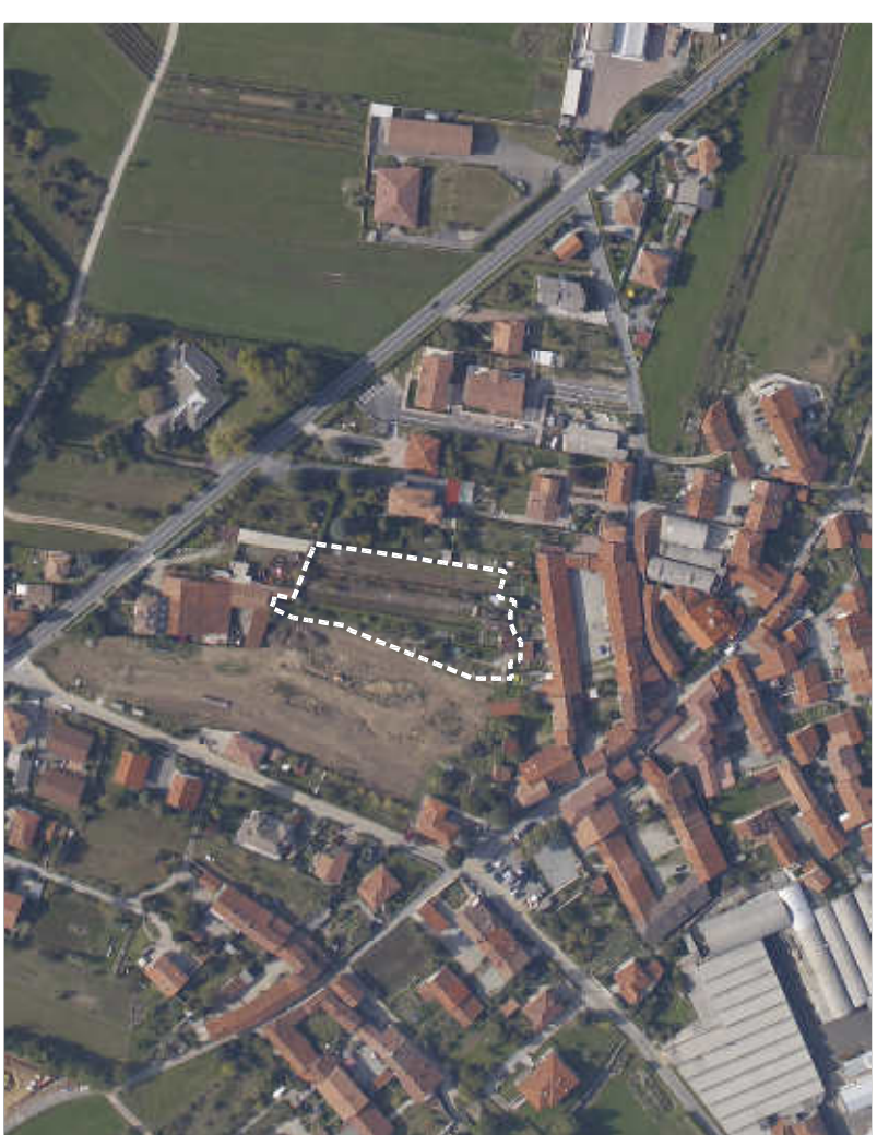
TAVOLA N. 6 SCALA 1:500